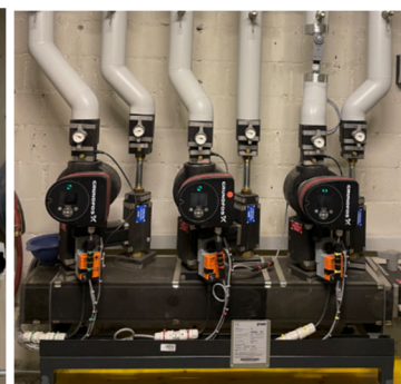
Abbildung Verteiler vorverdrahtet