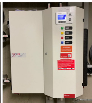
Abbildung Hoval GIRO 2HK Kompaktstation